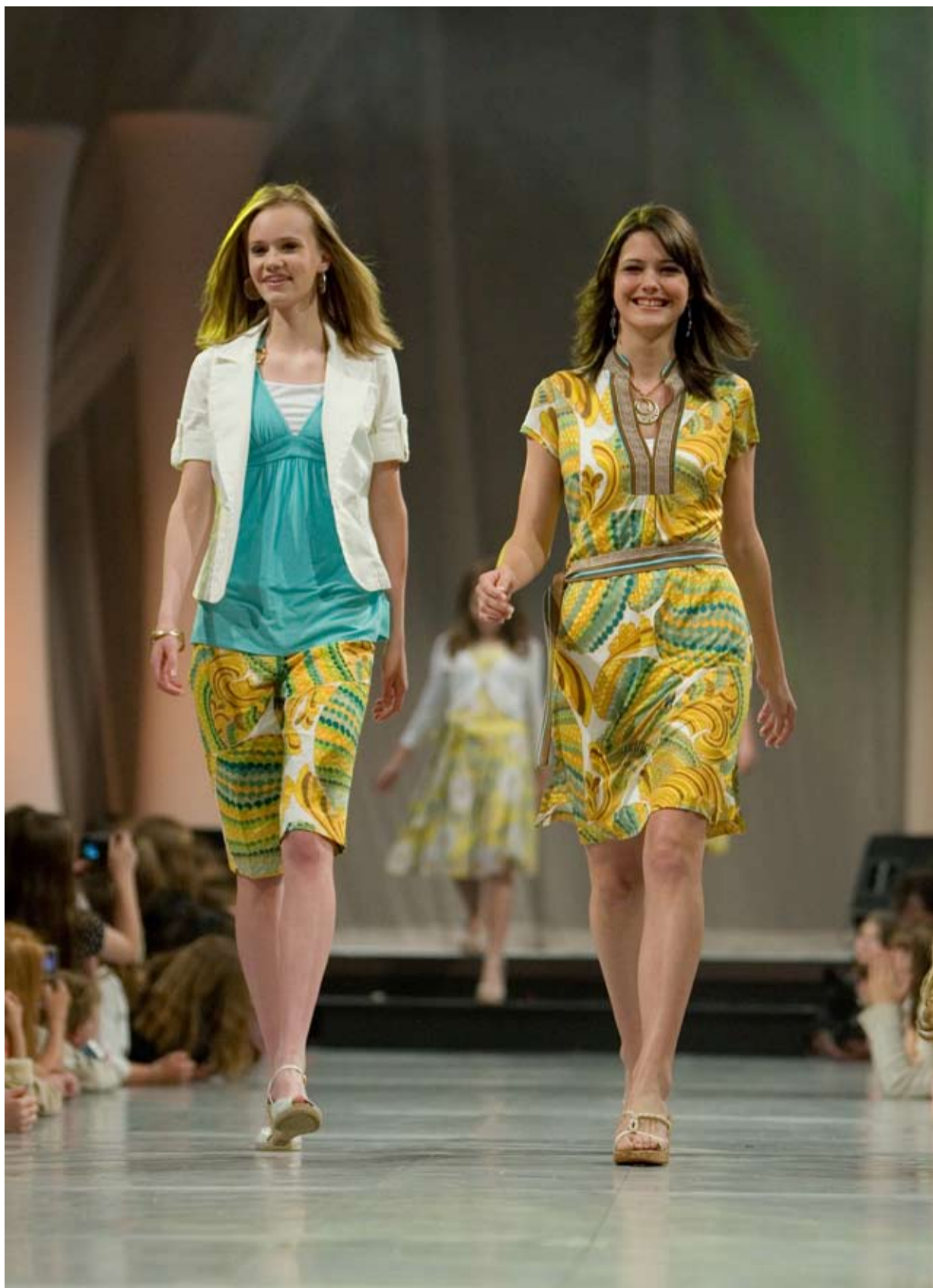
“纯粹时尚”的乖女虽然身体都包裹得有点严实，但走秀却不比比基尼小姐逊色

少女穿着指南：裙底不可高过膝盖的四个手指宽度；衣服领口到锁骨的宽度同样如此；不穿极薄或透明的衣料；上衣胸围处不可过紧绷；背后不应透出内衣形状；紧身短背心外面一定要套上毛衣或夹克衫；胸罩的垫片不应过厚……这些听上去像 1950 年代流行的“健康”电影里的教诲，但事实上，它们出自美国一个名叫“纯粹时尚”的新选秀活动。